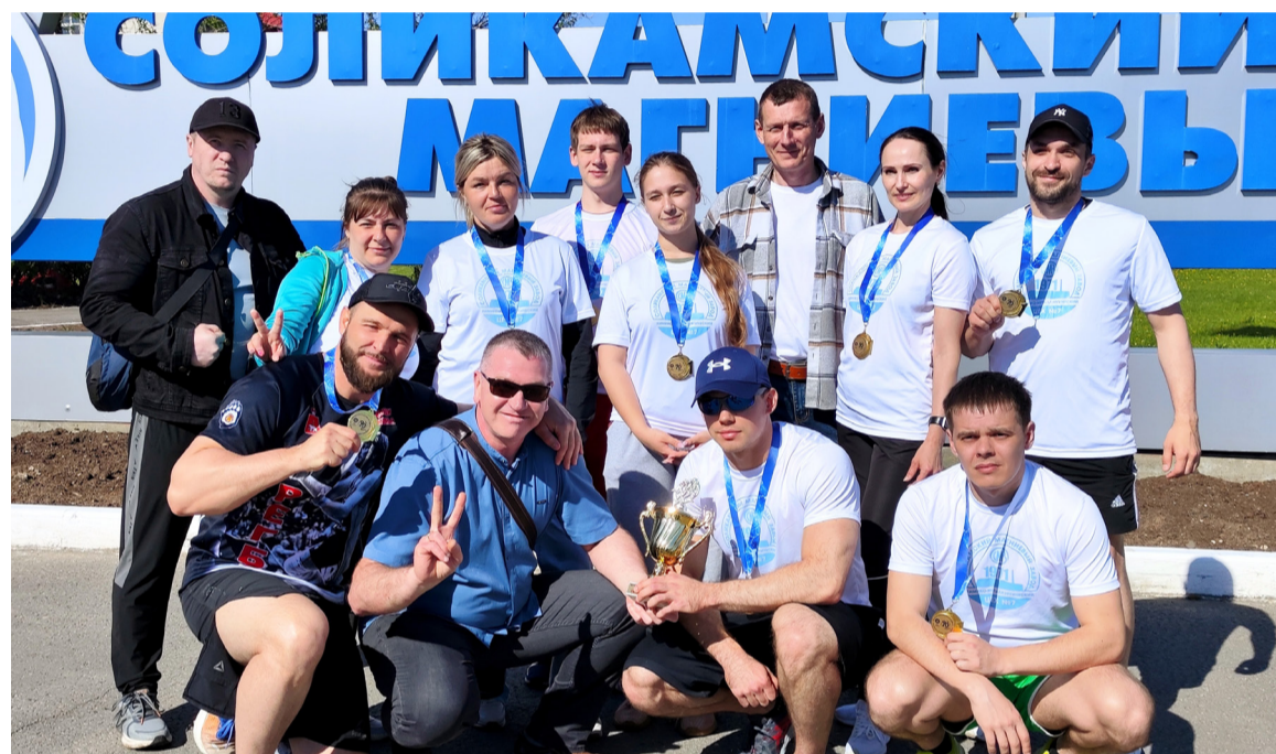
Кубок «Магниевика» в руках победителя – цеха № 7