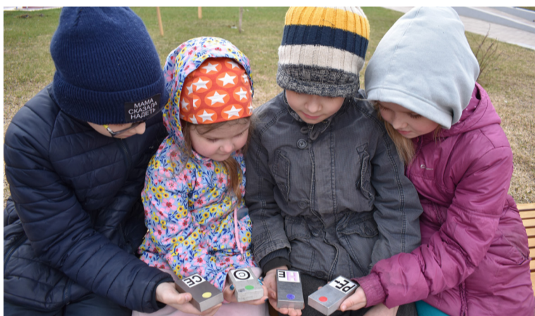
Юные магниевики изучают вес слитков

Одной из самых впечатляющих, по всеобщему мнению, стала станция под названием «Ценный груз». Здесь команды вспоминали виды нашей продук-