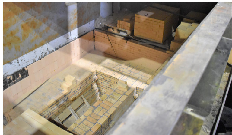
Внутри нового агрегата