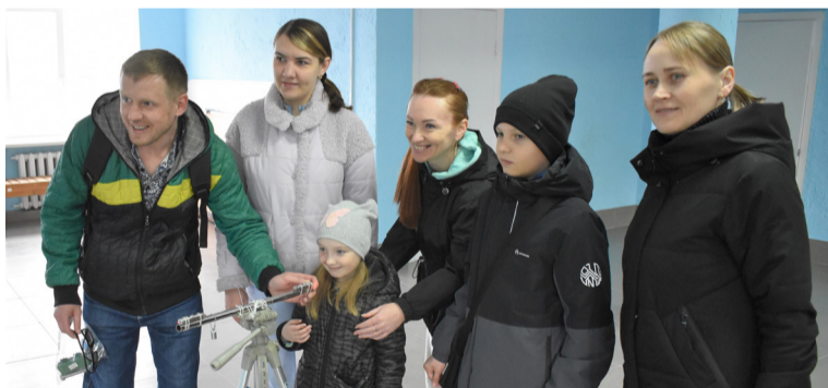
Победители на популярной станции «Ценный груз»

ции и с помощью двустороннего лазера соотносили её с шифром. В холле дома спорта то и дело раздавалось: «Алюминий, нержавеющая сталь? Нет, не наш профиль! Пентаоксид ниобия? Да! Магний, титан! Однозначно, да!»