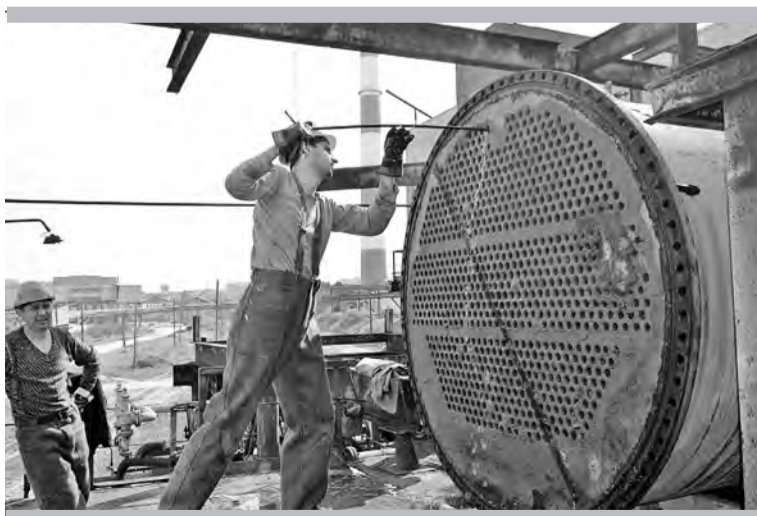
Чистка конденсаторов аммиачной холодильной установки

на складе хлора: чистка, ревизия запорной арматуры на хлоропроводах и хлорных танках.