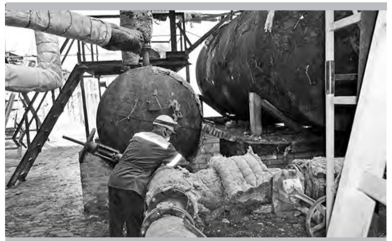
И теплоизоляровщикам нашлась работа