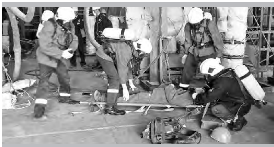
Помощь оказана грамотно. «Пострадавший» спасён

Особое внимание проверяющие (специалисты служб производственного контроля: ОТиПК, главного механика, главного энергетика, также, СРЭБ, ПТО, ОТН) уделили состоянию мастерских и технологического оборудования. Проверили состояние слесарного инструмента, сварочного оборудования, средств пожаротушения, работу противопожарной системы, всевозможную отчётную документацию. Проверяли обеспеченность средствами защиты органов дыхания (СИЗ) и то, как используют их на своих местах сами работники цеха.