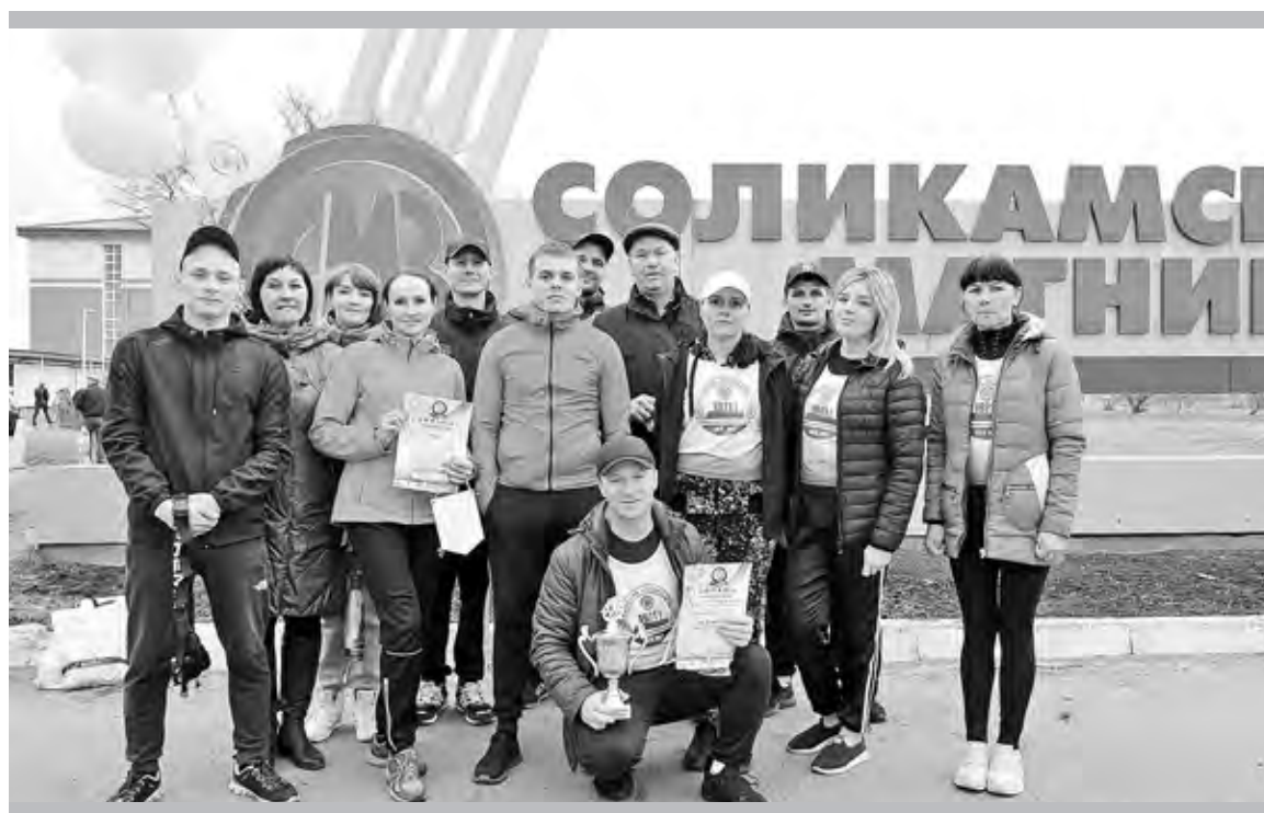
Команда цеха № 7

Успел передать эстафетную палочку и упал навзничь легкоатлет цеха № 20, но тут же ринулись к нему «свои» болельщи-