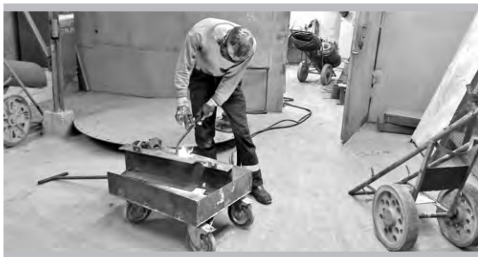
Проведение сварочных работ. Нарушения выявлены. Выводы сделаны

В апреле в цехе № 7 прошло комплексное обследование на предмет соответствия производства требованиям охраны труда, промышленной и пожарной безопасности, а также требованиям санитарного законодательства РФ.