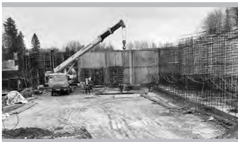
Строительство новой ёмкости ПХРО – процесс длительный и сложный

Получит свою долю внимания всё, что так или иначе связано с поддержанием нашего производства. В том числе, планируем в этом году закупить собственные железнодорожные вагоны. Это поможет нам более ритмично отгружать нашу продукцию, так как в стране сегодня острая нехватка вагонов, а цены на их аренду выросли за полтора-два года в несколько раз.