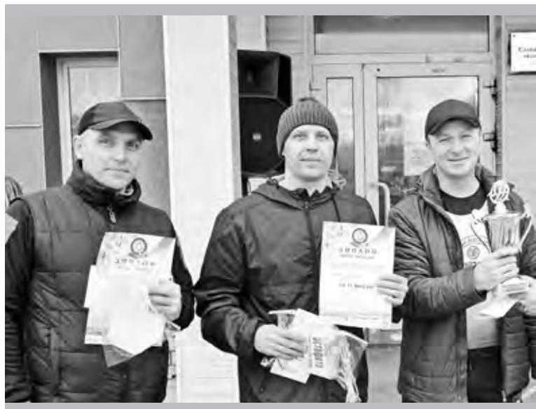
Капитаны команд-победительниц первой группы цехов

ки. Боже, как же они кричали, прыгали, размахивали руками, иногда даже мешая спортсменам! Кстати, нынче была замечена дружная «могучая кучка» начальников цехов, чьи команды сражались на дистанции.