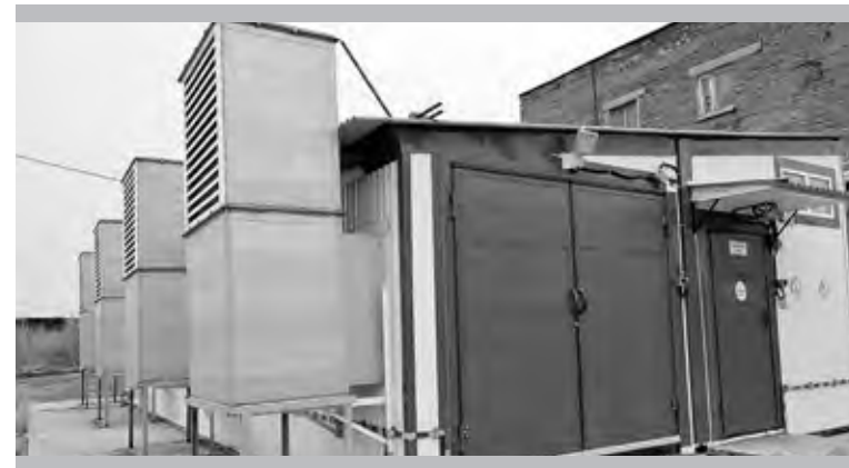
Новая азотная станция свои плоды уже принесла. На очереди второй этап модернизации установки воздуходеления

По первому цеху. Планируя дальнейшее развитие производства и в свете предупрежде-