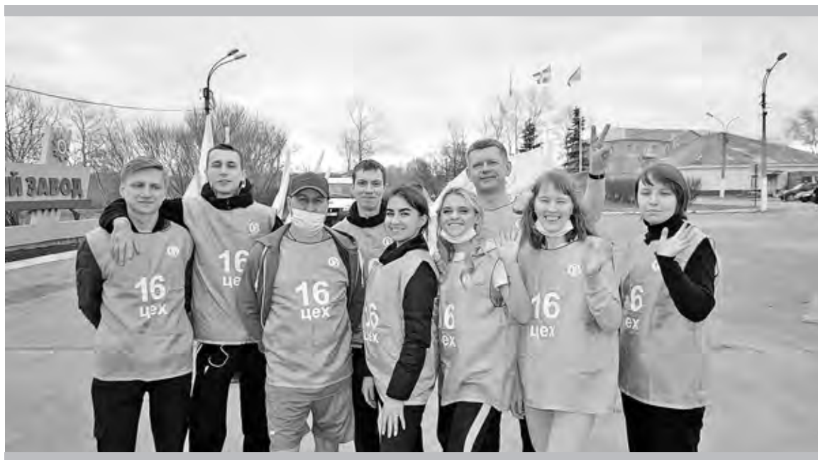
Команда цеха № 16