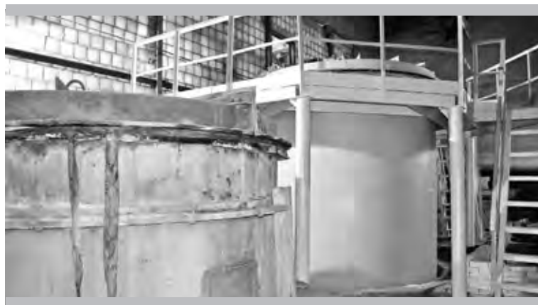
В хлорной компрессорной цеха № 4. На все эти хлорные фильтры придёт автоматика

Крупное мероприятие по плану развития завода – техническое перевооружение аммиачно-холодильной установки этого же цеха. Проект, которым мы занимались последние годы, прошёл все необходимые согласования. Осенью прошлого года был заключён контракт. По плану, новое оборудование мы должны были получить в конце июня. Но в связи с последними политическими событиями, наши немецкие коллеги