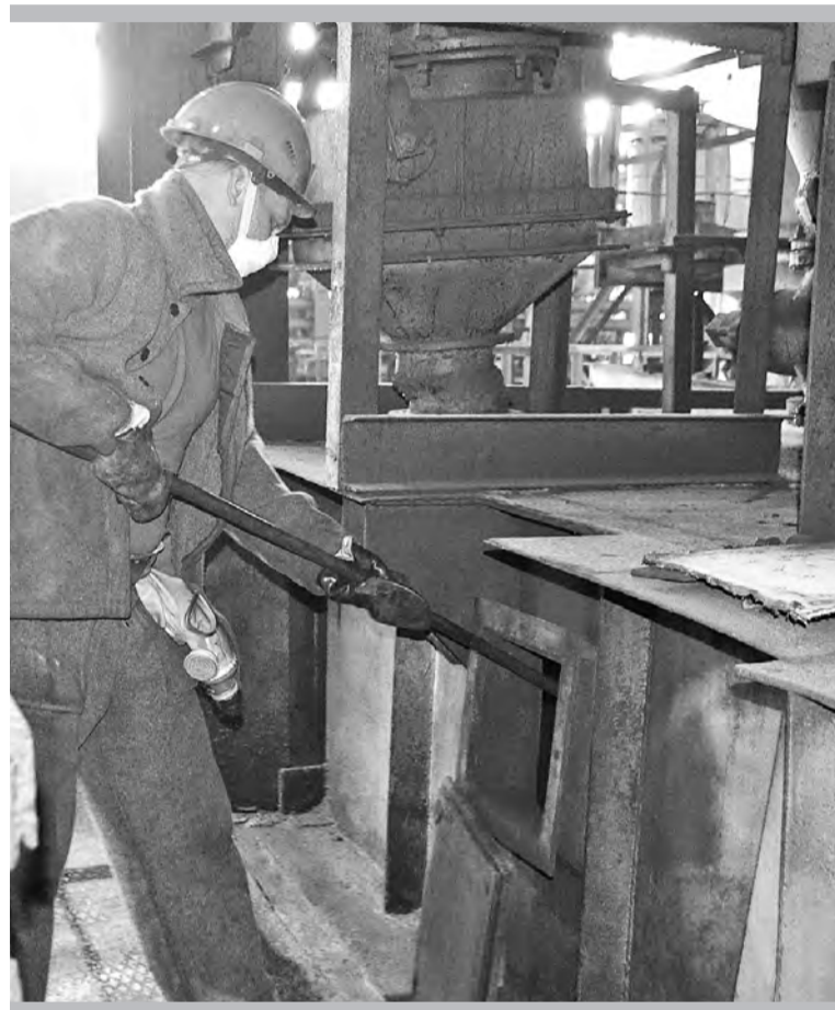
Д.А. Вебер, печевой: через такие «окошки» на верхней отметке ведётся загрузка работающего хлоратора

«В августе, помимо обычной номенклатуры, в плане производства у нас ещё и пентахлорид ниобия особо чистый появился, — поделился другими новостями третьего