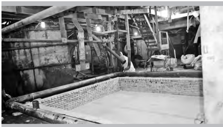
Будущий хлоратор № 2: и снова всё с нуля