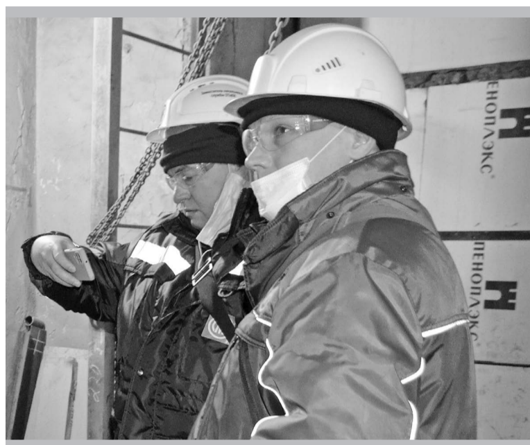
Каждый недочёт – на карандаш (то есть на телефон)

Прекрасно понимают это и хозяева объекта. Никаких серьезных нарушений в охране труда проверкой не выявля-